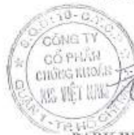
PARK WON SANG